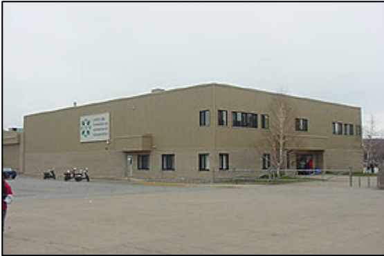
Centre de formation en entreprise et récupération (CFER)