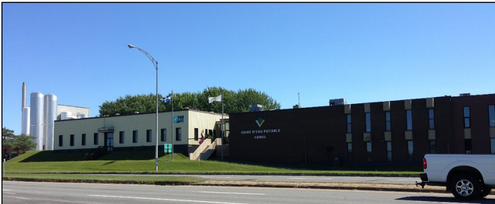
Station de traitement de l'eau potable de Victoriaville