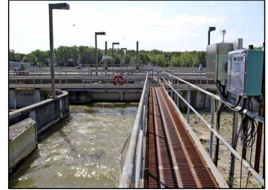
Station de traitement des eaux usées de Victoriaville