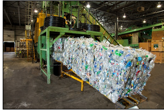
Centre de tri de Victoriaville